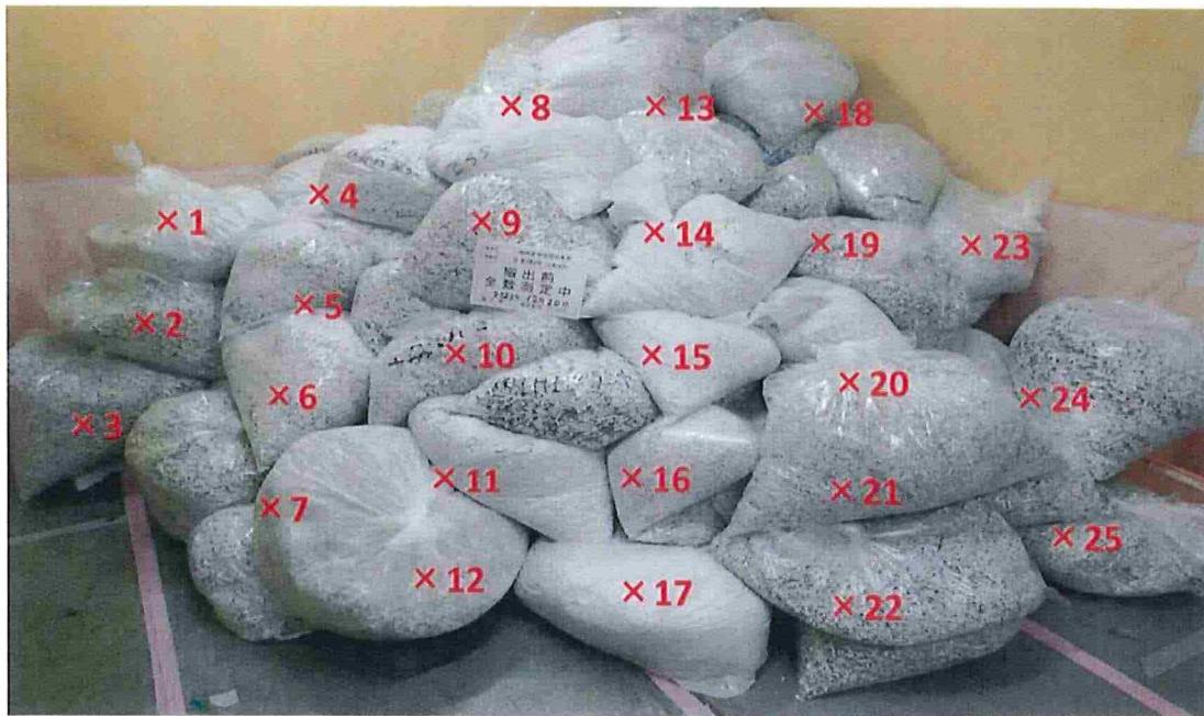
シュレッター屑 表面線量率測定結果 ( \mu\text{Sv/h} )

測定器： F1-SC-013 時定数： 10 sec 【対象物】 B G : 30 sec 測定結果： 0.07 \mu\text{Sv/h}