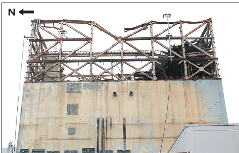
1号機外観大型カバー設置前(撮影日:2022年7月15日)