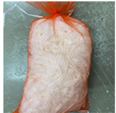
バクテリアのエサ