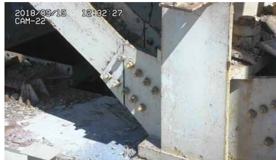
< Xブレース切断箇所 >