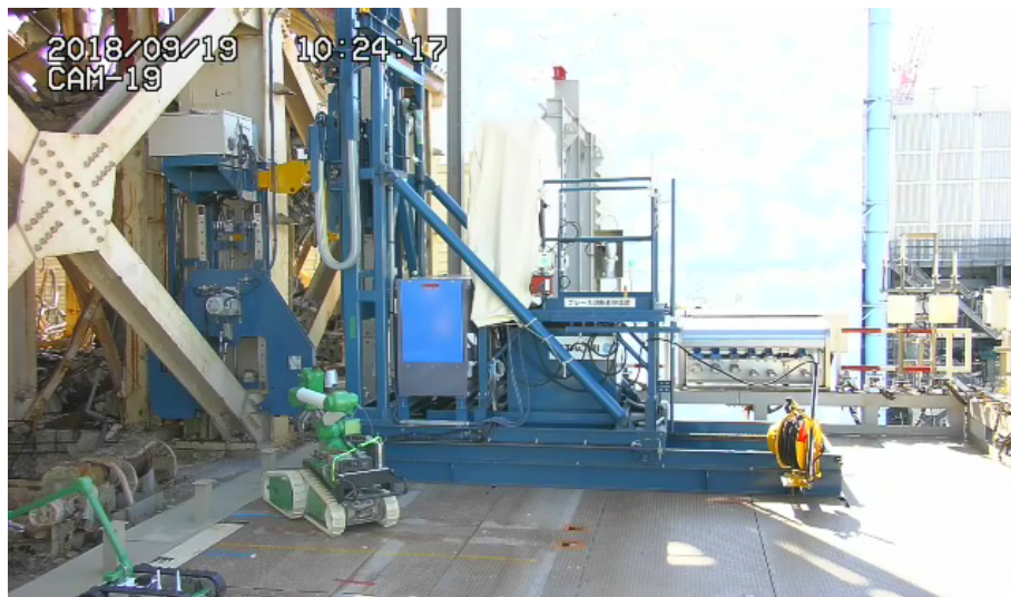
< バンドソー切断中 >