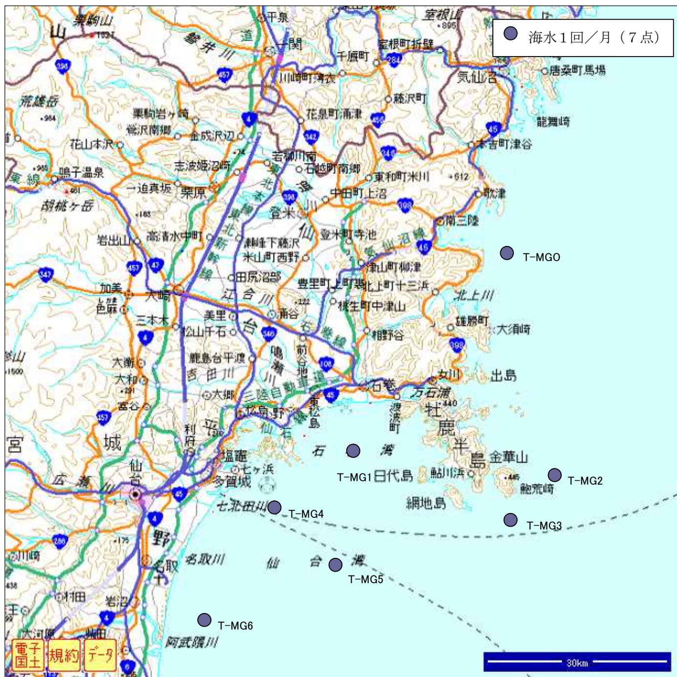
図3. 海水等サンプリング位置（宮城県沿岸）