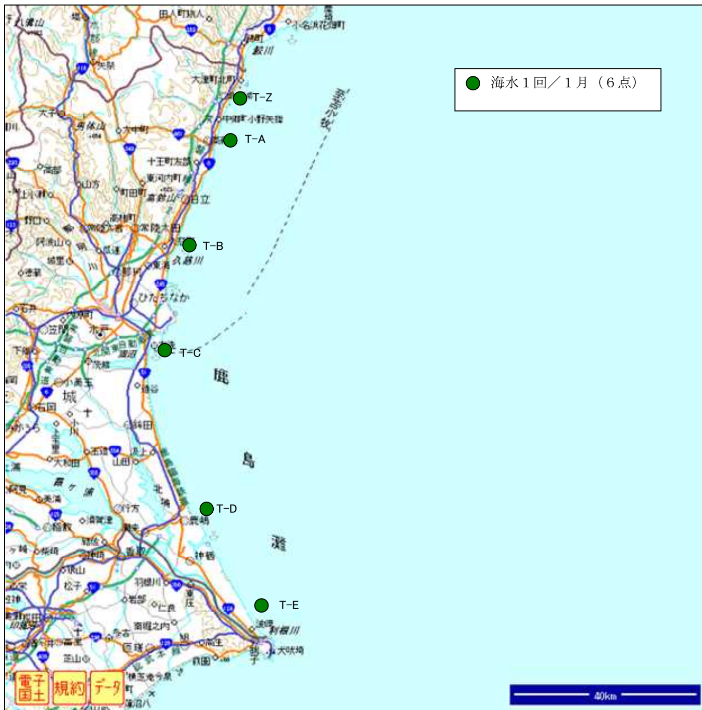
図2. 海水等サンプリング位置（茨城県沿岸）