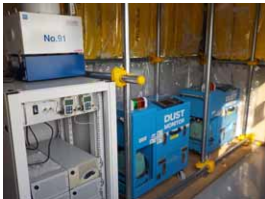
図. 構内ダストモニタ