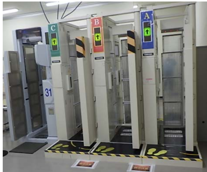
免震重要棟(地震前撮影)