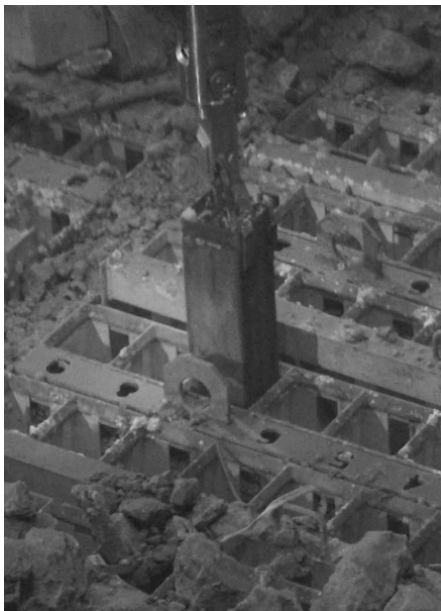
燃料ラックからの吊り上げ