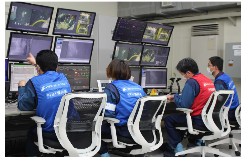
遠隔操作室における作業状況