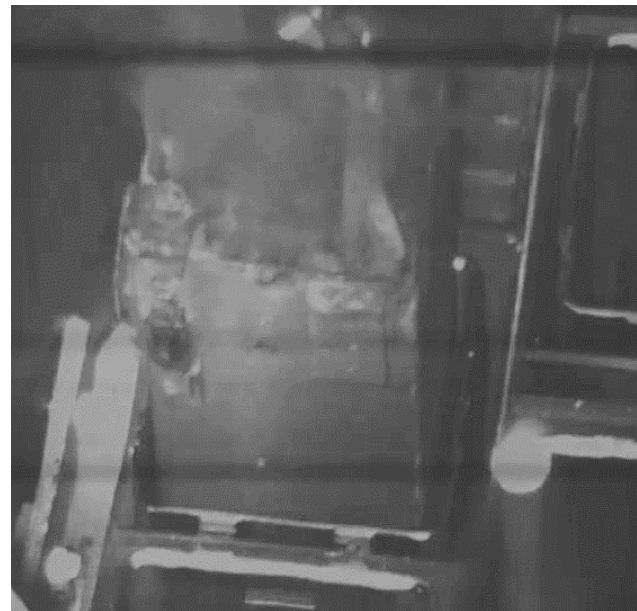
輸送容器への装填