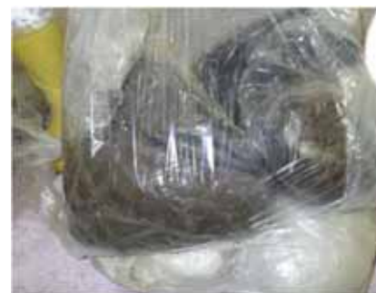
図3. 内容物 (水分を含んだ吸着材)