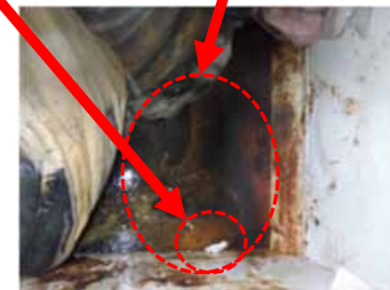
図4. コンテナ内部の状況