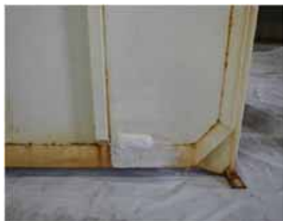
図1. 腐食箇所の補修箇所