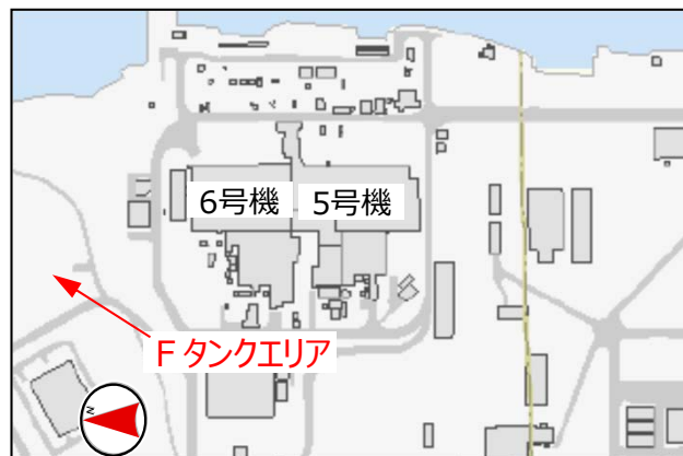
【Fタンクエリア位置図】