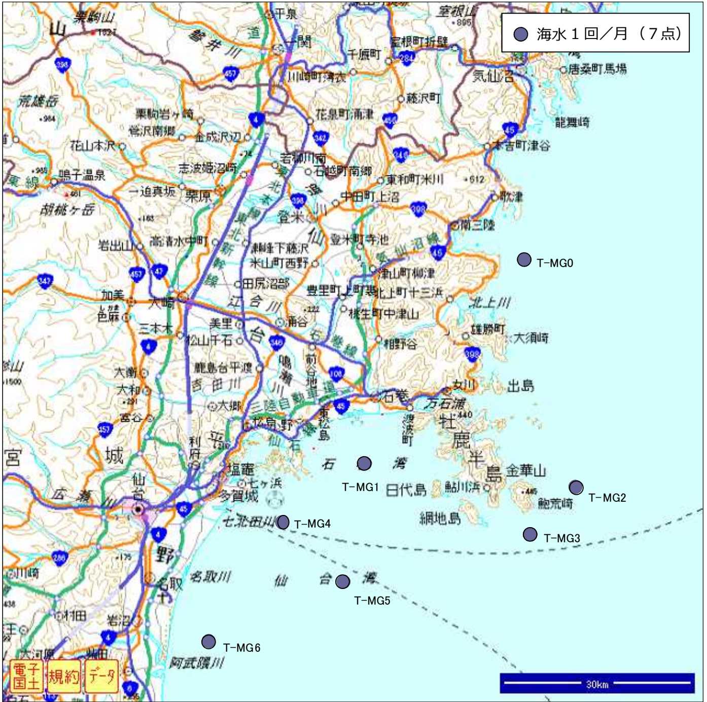
図2. 海水等採取位置 (宮城県沿岸)