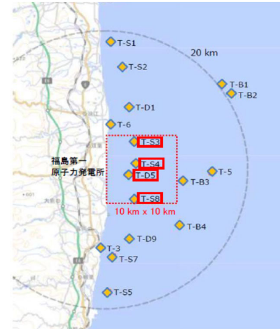
図2 試料採取地点 発電所正面の10km四方内

: 迅速に結果を得るモニタリング対象地点（4地点） 指標（放出停止判断レベル） 30 Bq/L 分析頻度：週1回(T-D5)、月1回（T-S3,T-S4,T-S8）