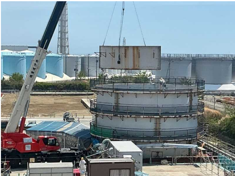
EエリアD1タンク解体作業の様子（2026年5月12日）