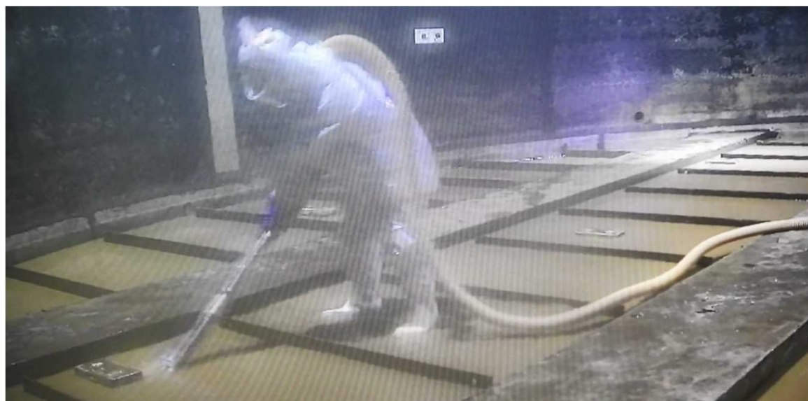
EエリアD1タンク内を洗浄する様子 (2025年12月24日)

※作業安全や放射性物質の飛散防止などを目的にタンク解体の作業手順を統一化する取り組み