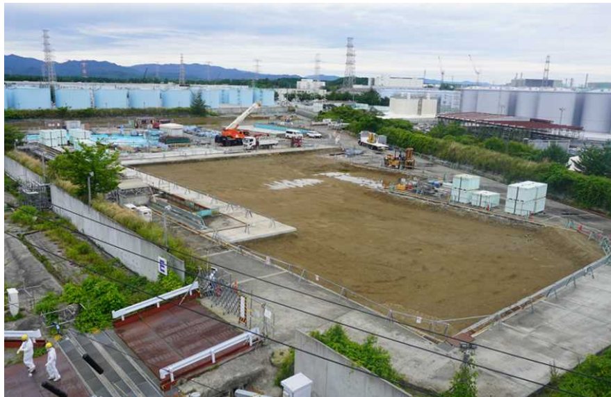
D1タンク解体後のEエリアの様子（2026年6月15日）