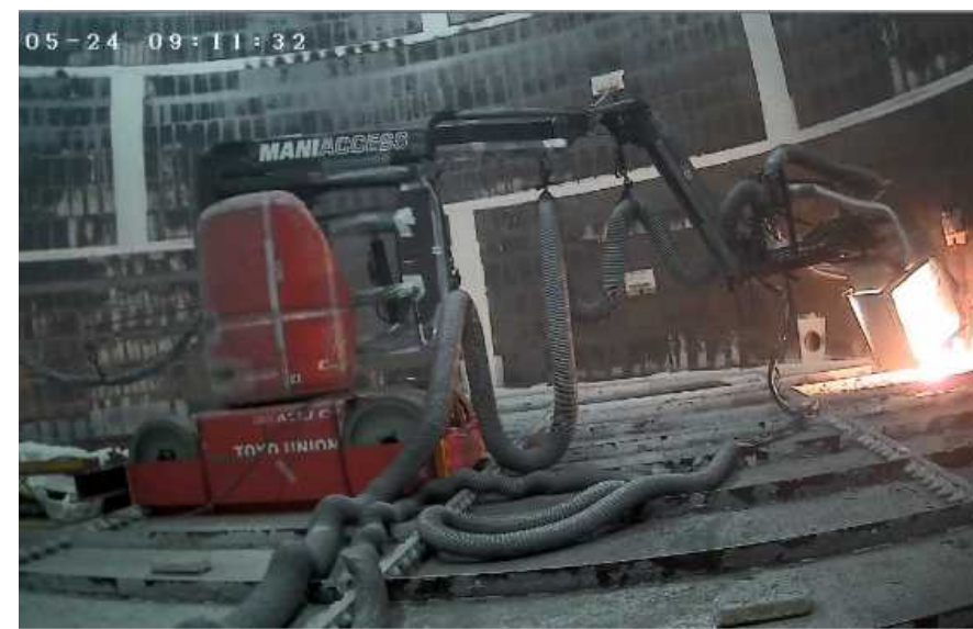
Eエリアタンク内におけるレーザー除染の様子 (2022年5月24日)