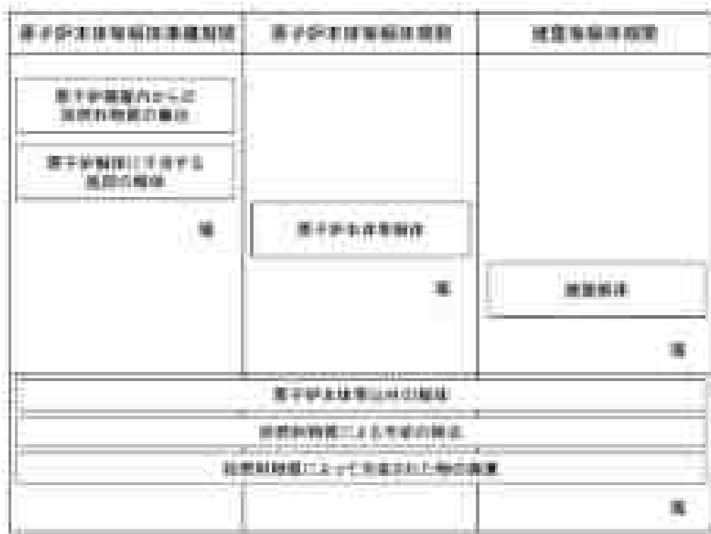
図15-1 想定廃止措置工程

6号発電用原子炉の廃止措置は、「原子炉等規制法」に基づく廃止措置計画の認可以降、原子炉本体等解体準備期間、原子炉本体等解体期間、建物等解体期間を経て、段階的に30～40年程度をかけて廃止措置を進めていく予定であるが、具体的な工程については、廃止措置を開始するまでに検討し、廃止措置計画に記載し、認可を受けるものとする。想定廃止措置工程を図15-1に示す。