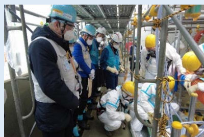
ALPS處理水的現場採樣驗收