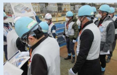
放水立坑周邊的實地調查