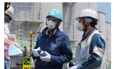
IAEA的格羅西總幹事（Rafael Mariano Grossi）視察ALPS處理水相關設備（2022年5月）