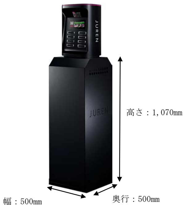
B. 専用什器付き(1台置き)

※ 設置場所によって、レンタルスタンド本体の単体設置以外に、様々なバリエーションをご用意しています。主なバリエーションは以下の通りです。