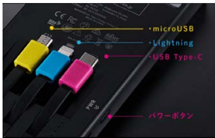
B. 3種類のコネクタ（本体裏面）