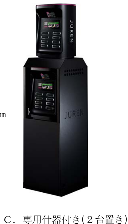
C. 専用什器付き(2台置き)