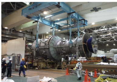
新しいガスタービン本体の据付作業