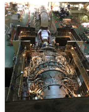
ガスタービン設備の組立作業

※火力発電所の燃料費削減を目的とした設備対策につきましては、ホームページでも解説しています。