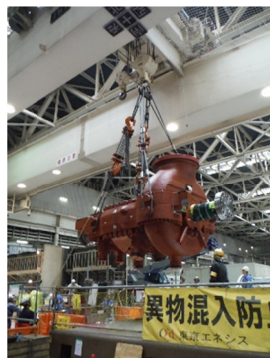
新しい高中圧蒸気タービン本体の据付作業