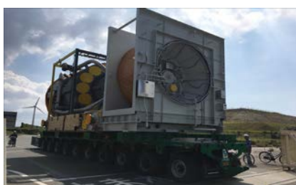
新しいガスタービン車室の 運搬作業