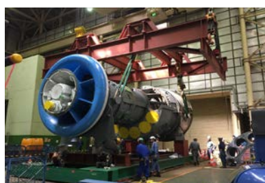
新しいガスタービン車室の 吊り上げ作業