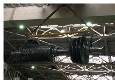
新しいガスタービンローターの 吊り上げ作業

※火力発電所の燃料費削減を目的とした設備対策につきましては、ホームページでも解説しています。 URL: http://www.tepco.co.jp/fp/challenge/reduction/equipment/index-j.html