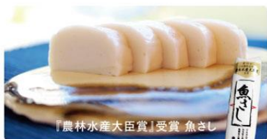
きせん 貴千のかまぼこ

代表的なヒラメ・メヒカリをはじめ、入荷によっては珍しい魚種が並ぶことも ※天候等により入荷のない場合がございます。