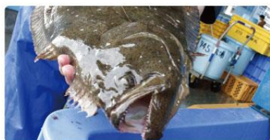
じょうばん 常磐もの 鮮魚

代表的なヒラメ・メヒカリをはじめ、入荷によっては珍しい魚種が並ぶことも ※天候等により入荷のない場合がございます。