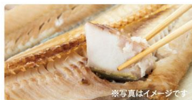
わだつみ 海神の干物

全国蒲鉾品評会最高賞も受賞した「魚さし」は魚本来の味と力を極限まで引き出した至極のかまぼこです