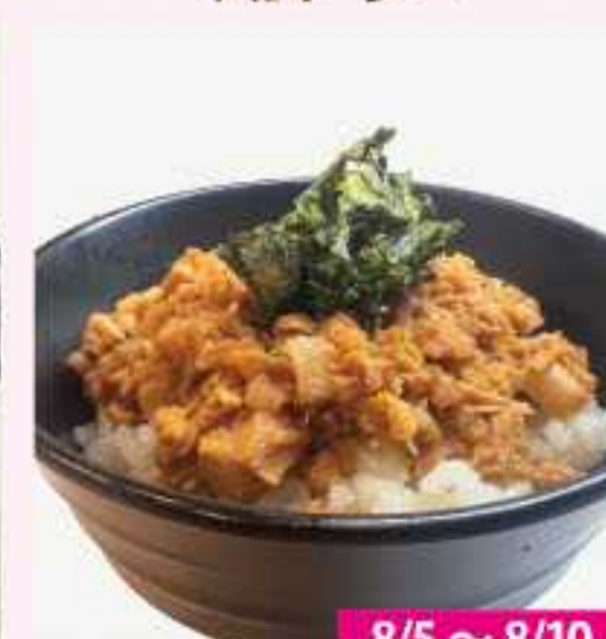
＜新宿地下ラーメン＞ ＜がっつりラーメンいち豚＞ 肉カスあおさ丼