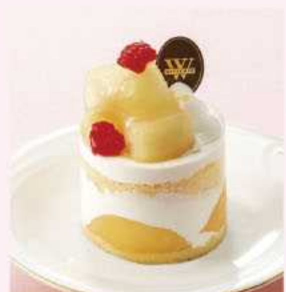
＜ヴィタメル＞ 福島県産桃のガトー

◎地下2階 = 食料品売場、地下1階 = 和洋菓子売場、 SHINJUKU DELISH PARK(小田急エース北館)