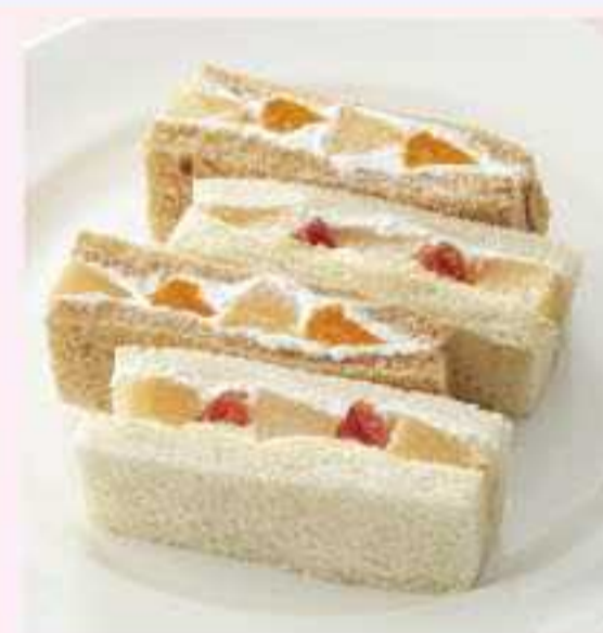
＜ブロッサム&ブーケ＞ ふくしまの桃ピーチメルバ風