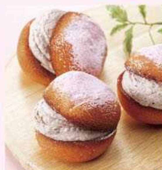
＜ルピアン＞ 福島桃の カフェホイップサンド