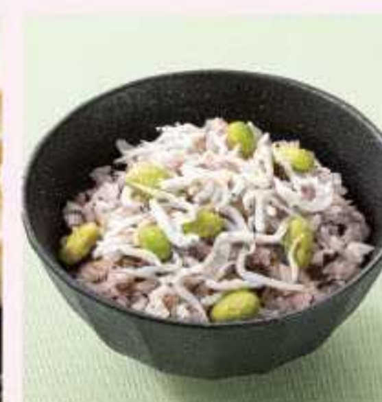
＜おこわ米八＞ 梅とシラスのおこわ