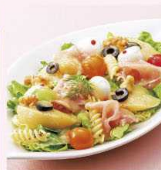
＜サラダデリ マルゴ＞ 福島産モモと生ハム & チーズの美食家サラダ