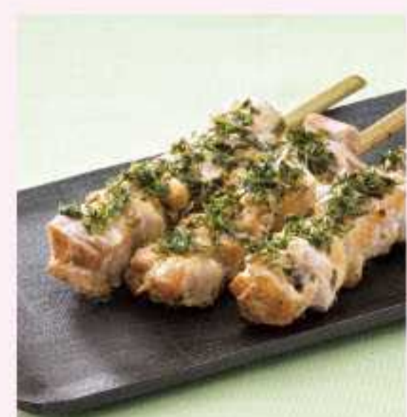
＜京鳥＞ 鶏ももあおさ串