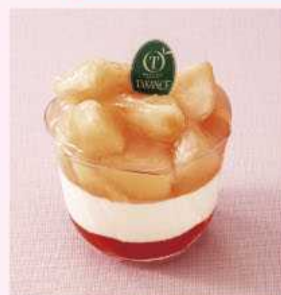
＜新宿高野＞ 福島県産桃のドルチェ