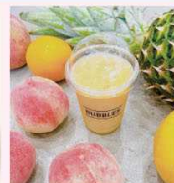
＜パルス＞ 福島県産桃のフローズン スムージー