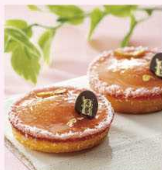
＜ビスキュイテリエ フルトンヌ＞ ガトー・ナンテ(福島の桃)