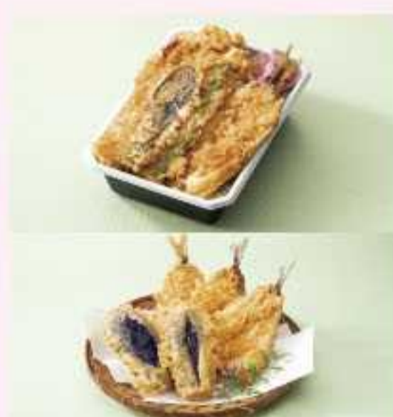
＜銀座天→ アジを使った弁当 天ぷら アジとなす