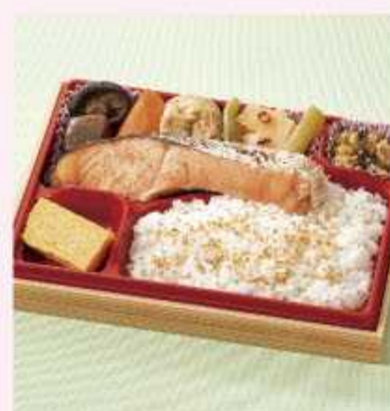
＜佃煮＞ トロける炙り銀鮭弁当