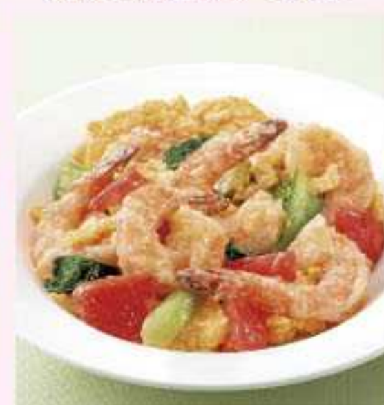
＜桂林＞ 大きな海老とトマトの卵炒め