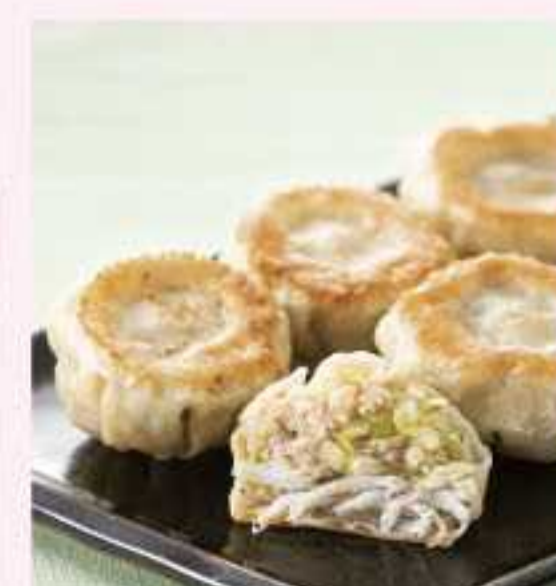
＜ハオチャオス＞ しらす餃子