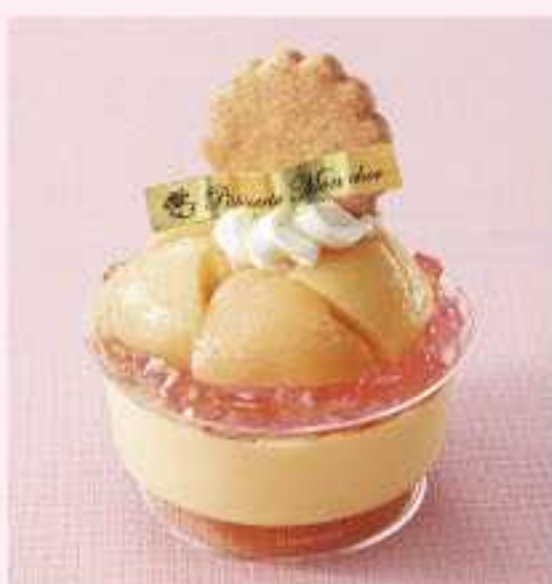
＜パティスリーモンシェール＞ パルフェ・バナラピーチ