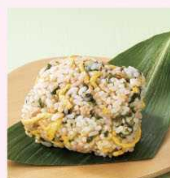
＜シンビ＞ あおさおにぎり