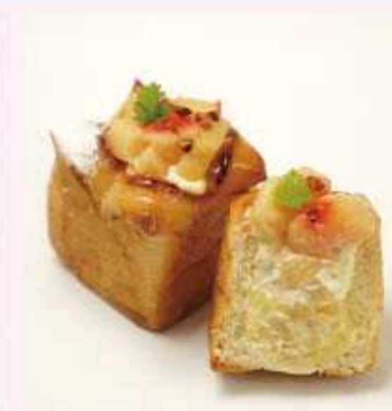
＜ボンパドウル＞ 福島県産白桃クリームパン