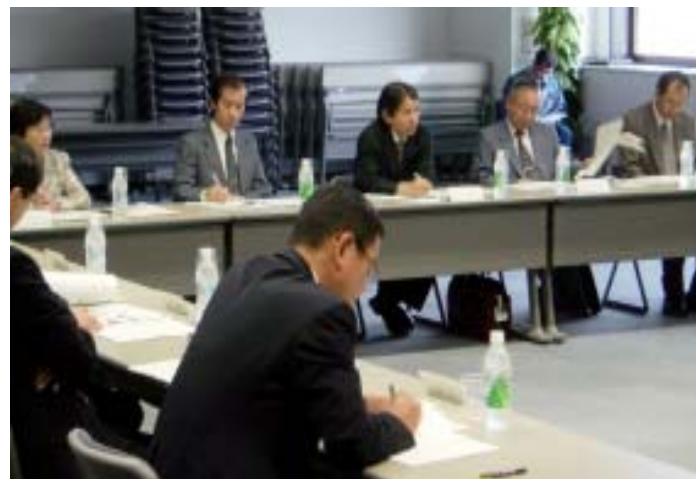
原子力安全・品質保証会議