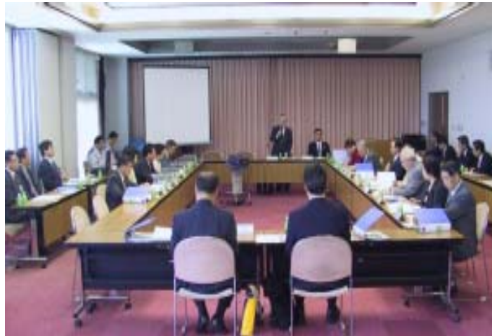
福島県原子力発電所所在町情報会議