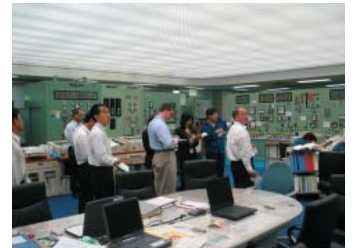
WANO ピアレビュー (福島第一)