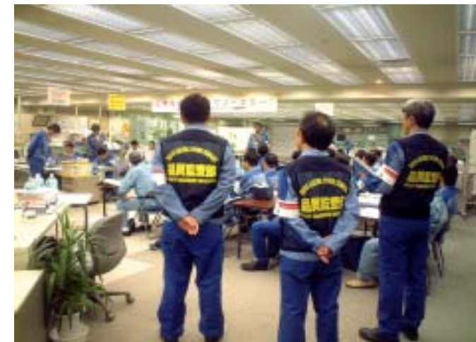
品質監査部による監査