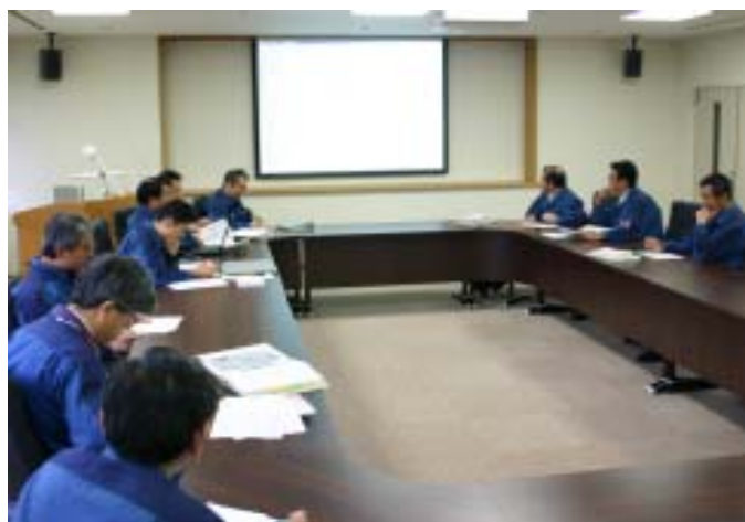
不適合管理委員会