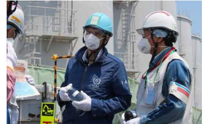
IAEA의 그로시 사무국장의 ALPS 처리수 관련 설비 시찰(2022년 5월)