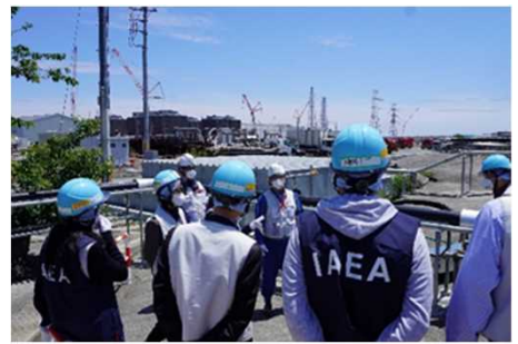
ALPS 처리수 이송 배관을 시찰하는 태스크포스 (2025년 5월 28일 후쿠시마 제1원자력발전소)

※1 IAEA 태스크포스 중 6명의 IAEA 직원과 7명의 국제 전문가가 방일 (국제 전문가: 아르헨티나, 캐나다, 한국, 중국, 미국, 베트남, 러시아)