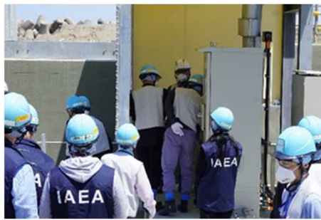
방수 수갱 상류 해수 배관수의 샘플링 선반 을 시찰하는 태스크포스 (2025년 5월 28일 후쿠시마 제1원자력발 전소)