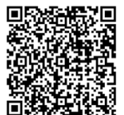
처리수 포털 사이트 IAEA에 의한 안전성 확인

https://www.tepco.co.jp/ko/decommission/progress/watertreatment/safetycheck/index-kr.html