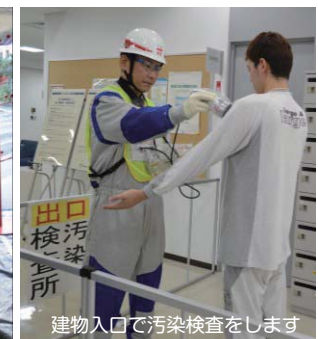
建物入口で汚染検査をします