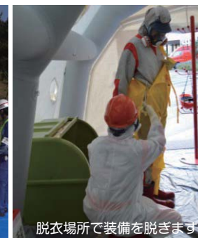
脱衣場所で装備を脱ぎます