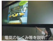
電気のしくみ等を説明