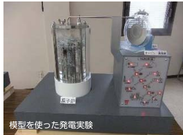
模型を使った発電実験