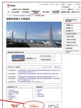
発電所ホームページ