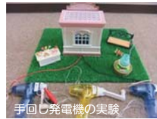
手回し発電機の実験