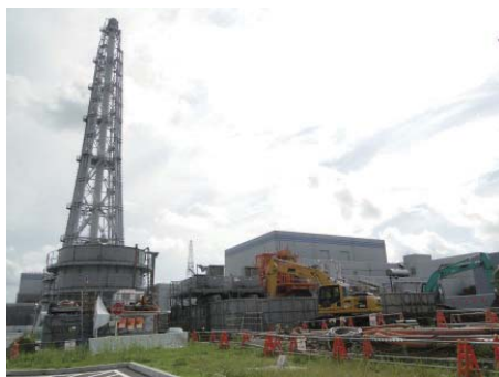
敷地内の立坑掘削作業