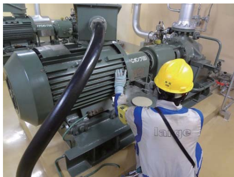
運転員による機器の点検

今後さらに増員を計画しており、非常災害発生時に確実に現場の対応ができるよう体制を強化してまいります。