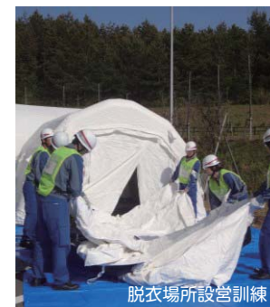
脱衣場所設営訓練