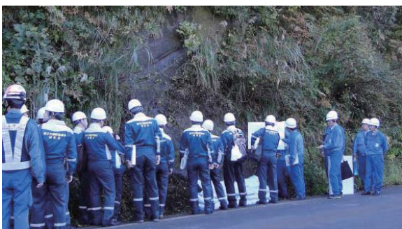
原子力規制委員会による地層・地形の確認