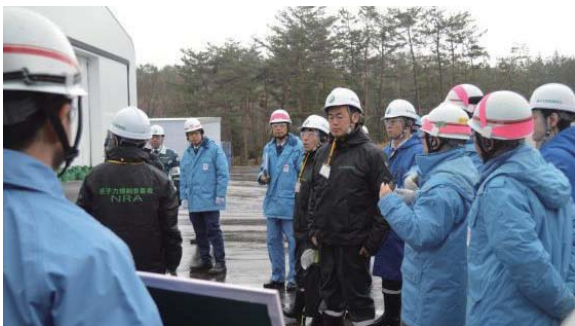
原子力規制委員会による設備の現地調査