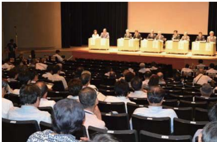
前回の説明会の様子