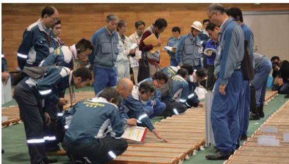
原子力規制委員会による岩石試料の確認