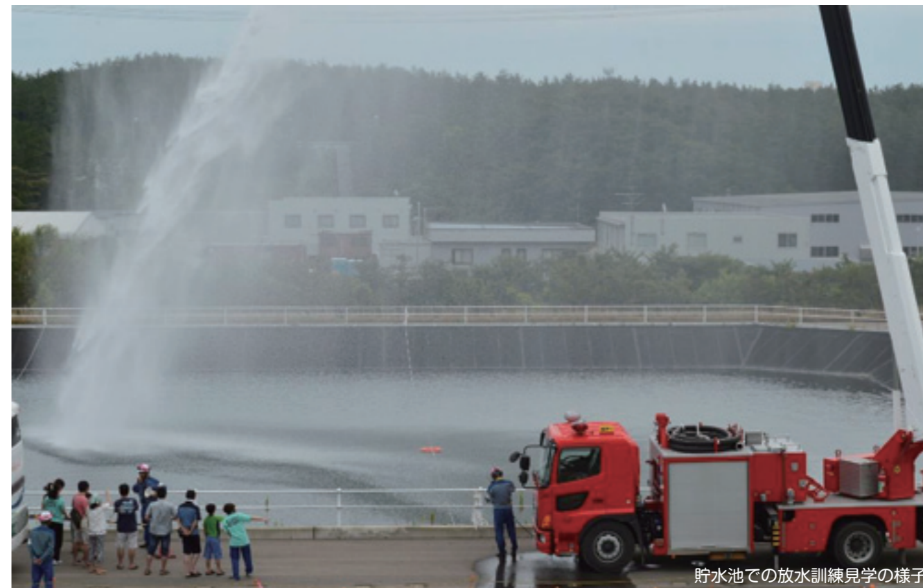
貯水池での放水訓練見学の様子