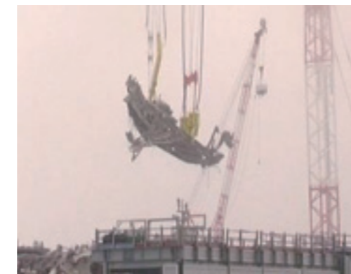
3号機大型ガレキの撤去作業の様子（8月2日）

海側遮水壁 遮水壁を構成する鋼管矢板の打設は一部を除き完了（98%完了）。残りの部分についても閉合作業を実施しています。