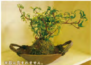
※器は含まれません。

定員：親子10組（先着） （6歳以上のお子さまとその保護者） 費用：1組1,000円（親子で1作） 会場：発電所ビジターズハウス 講師：フォーシーズン