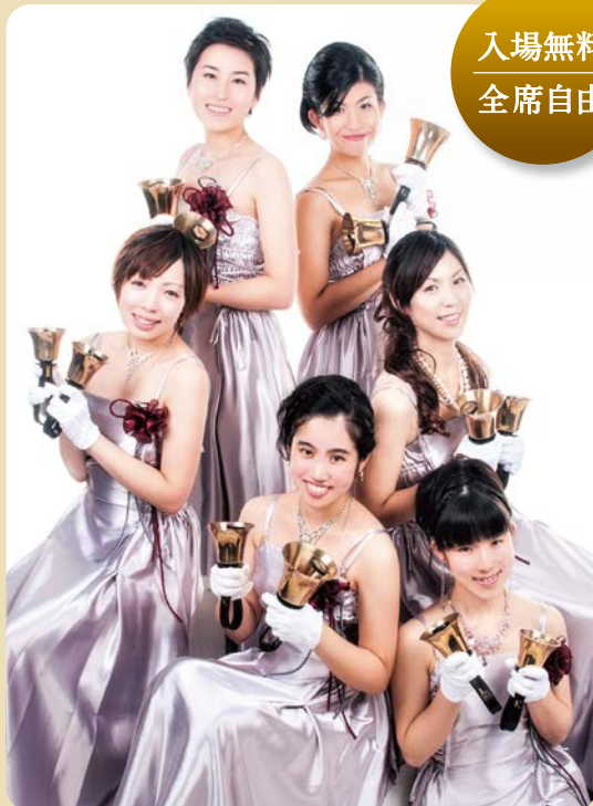
ハンドベル演奏グループ「ホワイトベル」による演奏を予定しております。