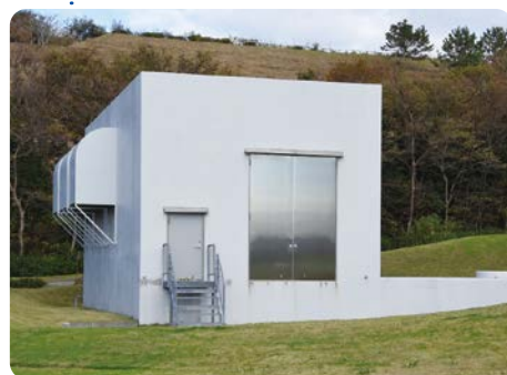
立坑(地上で発煙が確認された場所)