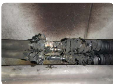
熱で溶けたケーブルの接続部