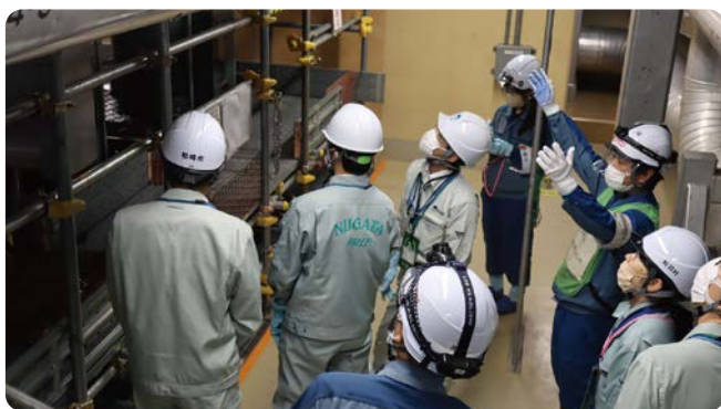
6月9日の状況確認の様子(7号機 タービン設備)

新潟県、柏崎市、刈羽村と当社は、発電所周辺地域の皆さまの安全の確保を目的として協定を結んでいます。協定に基づき、発電所の運転、保守管理などに関する状況や現場の状況を定期的にご確認いただいています。