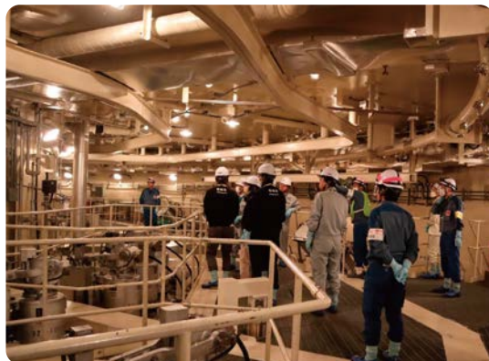
5月24日の状況確認の様子(7号機 原子炉設備)