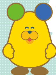
レインボーふうりん