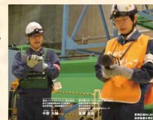
24時間体制の徹底した放射線管理 緊張感を持って業務を遂行する