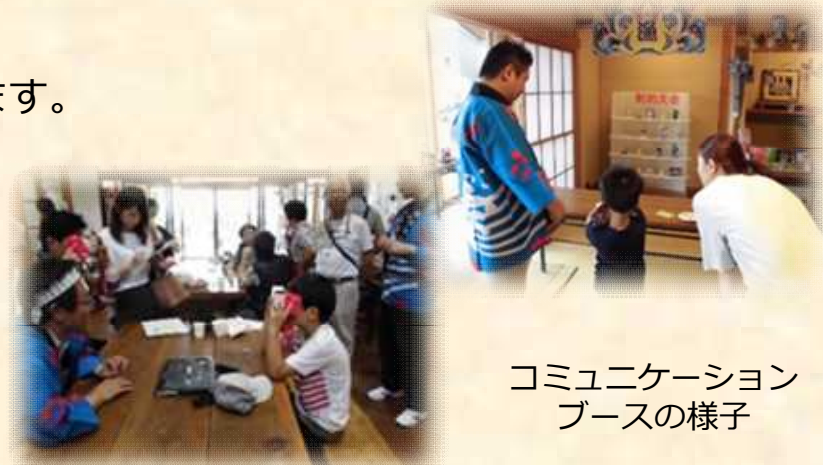
コミュニケーション ブースの様子