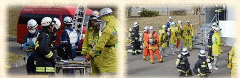
地元消防との 合同訓練の様子