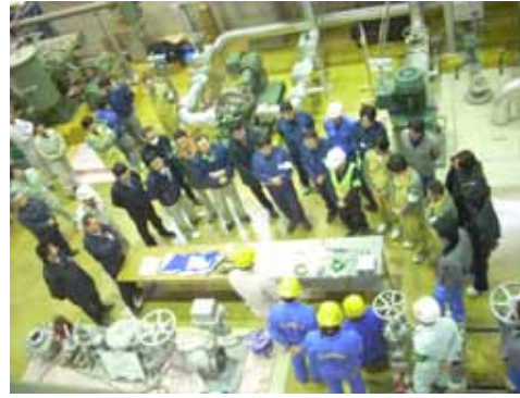
静電気の発生と特別危険物の発火の体感訓練