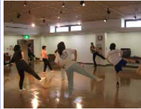
スポーツカルチャー教室

地域の皆さまからいただいたご意見やご要望にお応えできるよう、開催日や内容を工夫し、様々なイベントを企画・開催してまいります。イベント開催にあたりましては、発電所員と地域の皆さまとのコミュニケーションを大切にしております。