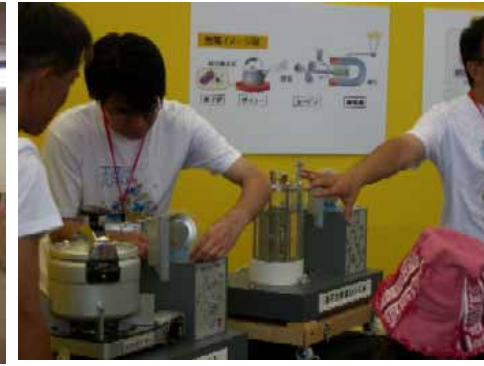
ジュニアサイエンスアカデミー

当社では、地域の皆さまからいただいた様々なご意見を今後の発電所の運営に活かし、信頼される発電所を目指して取り組んでまいります。引き続き当社に対するご意見・ご要望をお聞かせくださいますようお願いいたします。