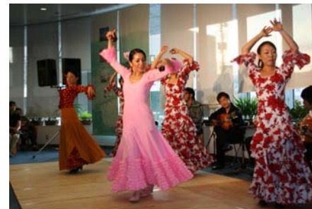
ミュージックライブ（カムフィー）