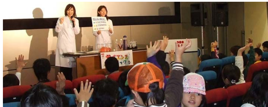
科学実験教室（サービスホール）