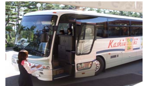
シャトルバスでの構内見学