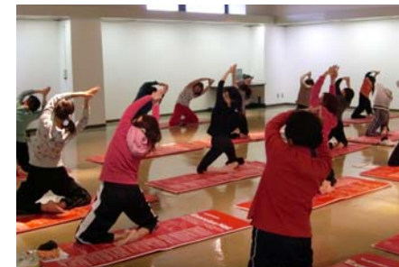
カルチャー教室（ヨガ）