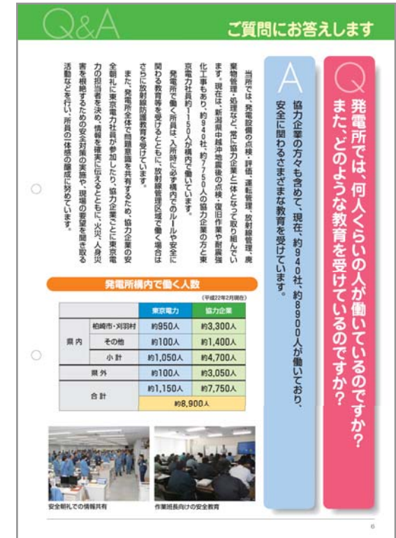
ニュースアトムの「ご質問にお答えします」