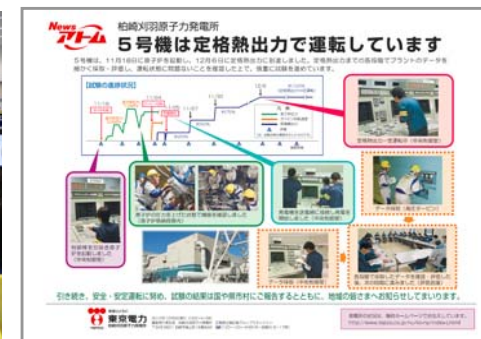
5号機の状況をお伝えるニュースアトム臨時号

当社では、地域の皆さまからいただいた様々なご意見を今後の発電所の運営に活かし、信頼される発電所を目指して取り組んでまいります。引き続き当社に対するご意見・ご要望をお聞かせくださいますようお願いいたします。