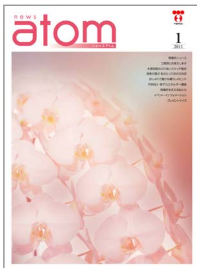
大きく、見やすくなったニュースアトム