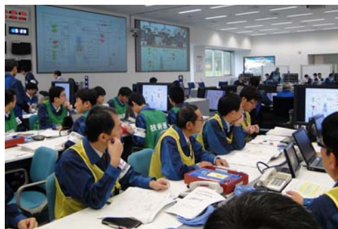
防災訓練の様子（免震重要棟）