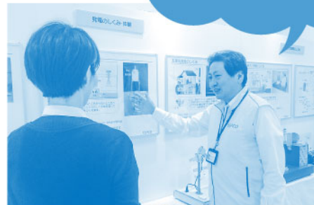
『東京電力コミュニケーションブース』開催風景

『東京電力コミュニケーションブース』は、当社の取組みをお伝えすると ともに地域のみなさまから直接ご意見等をお伺いさせていただく貴重な 場として、今後も各地で開催してまいります。