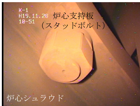
炉心支持板・ 炉心シュラウド