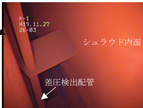
差圧検出・ほう酸水注入系配管