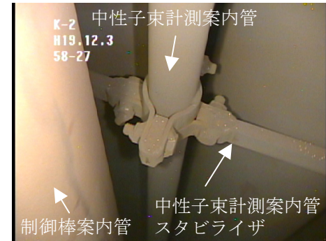
中性子束計測案内管 スタビライザ