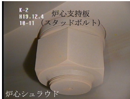
炉心支持板・ 炉心シュラウド