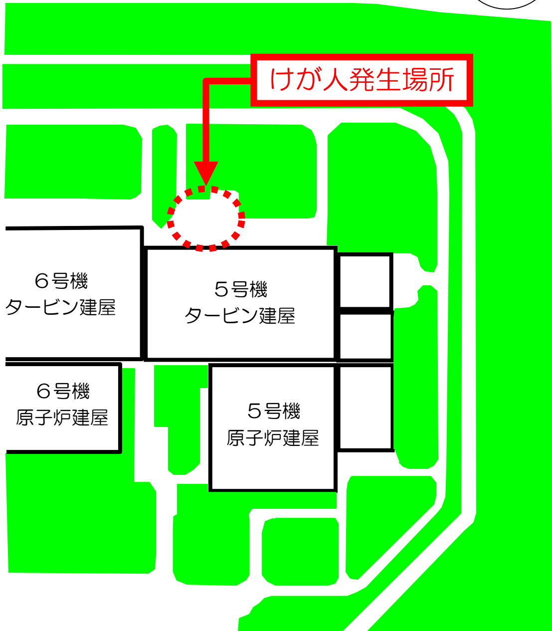
柏崎刈羽原子力発電所5号機 屋外