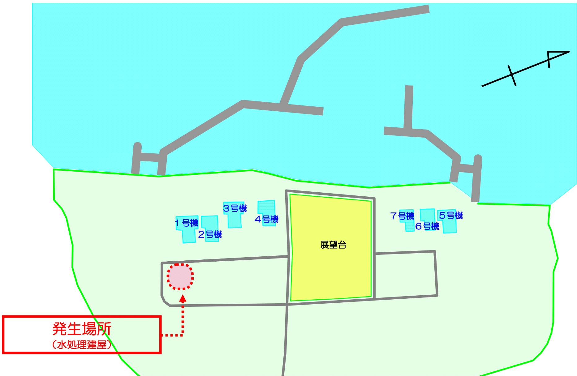
柏崎刈羽原子力発電所 屋外