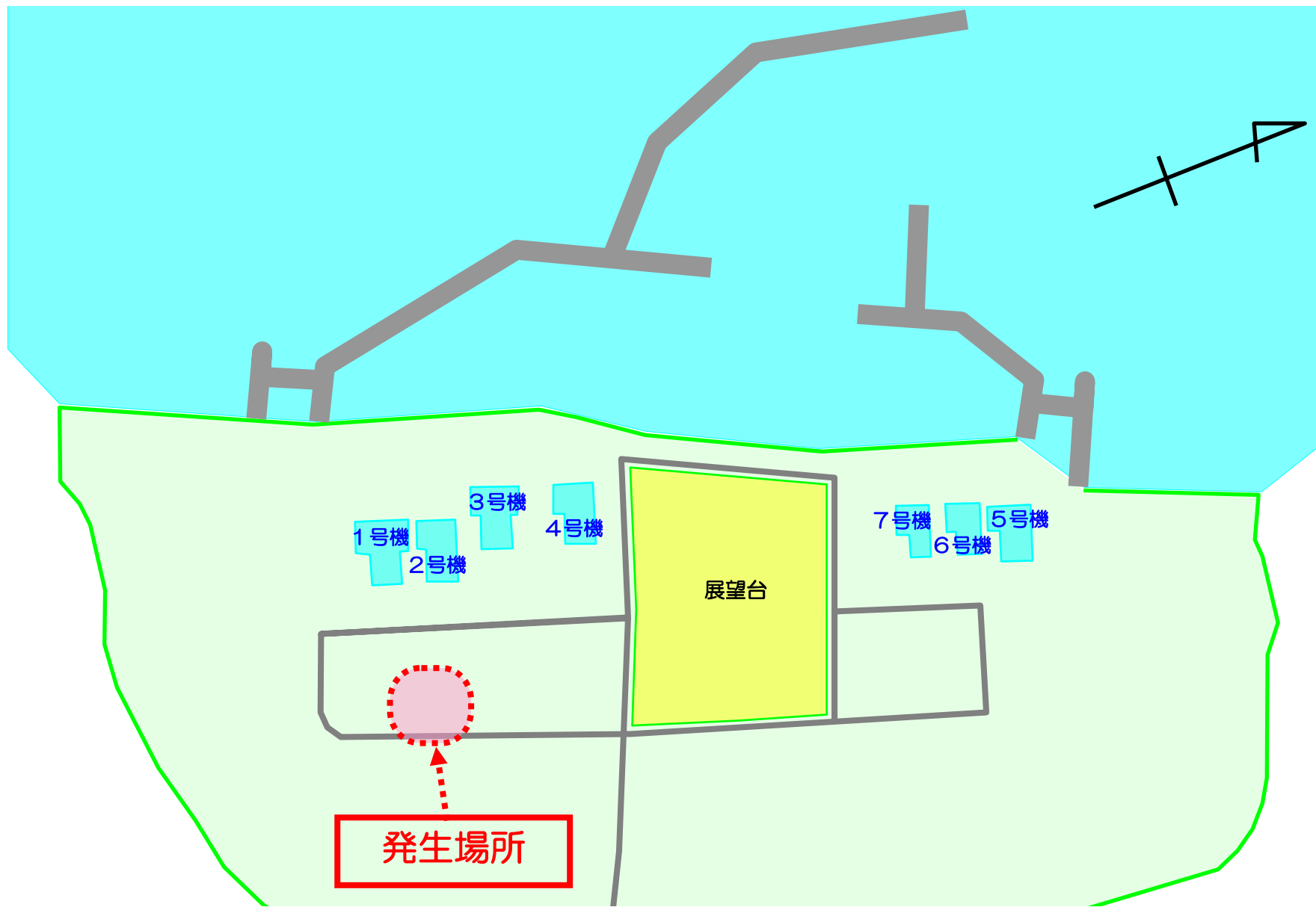
柏崎刈羽原子力発電所 屋外