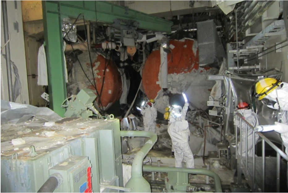
非常用復水器周辺