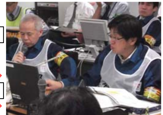
本店緊急時対策本部