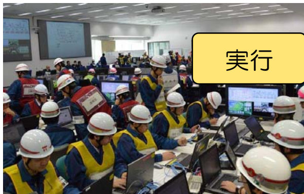
発電所緊急時対策本部 各担当班