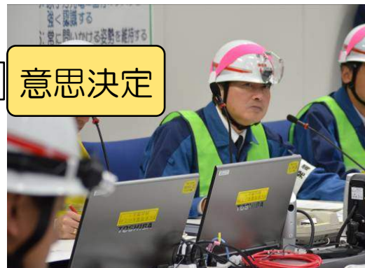
発電所緊急時対策本部 本部長