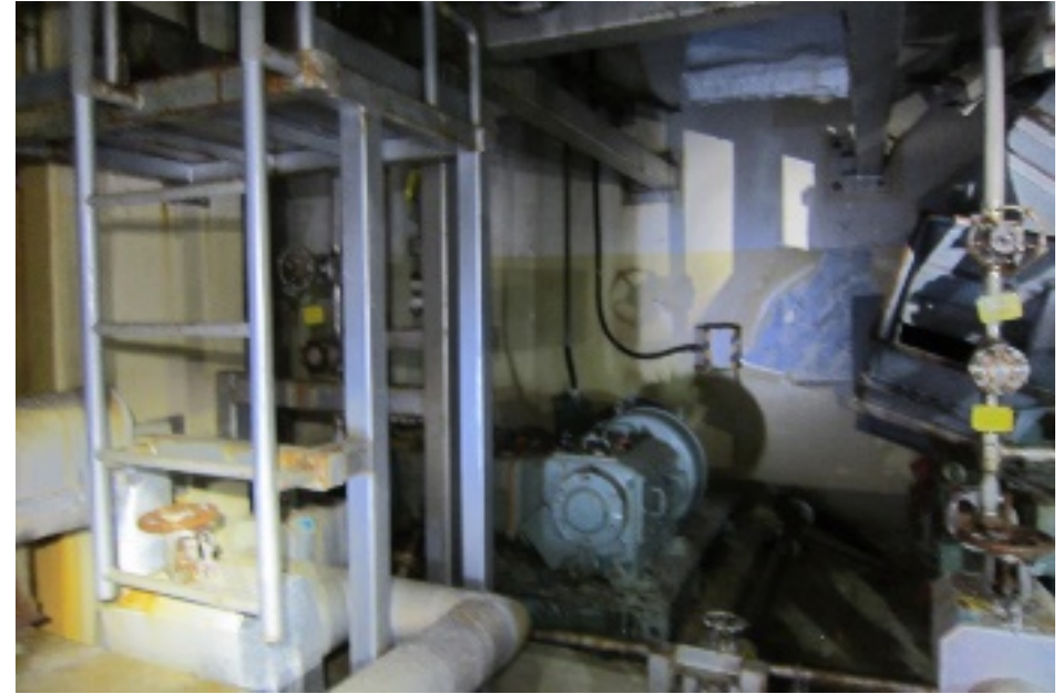
ほう酸水注入系周辺（事故後初めて入域）

【日 時】平成27年2月21日 13時00分頃～14時00分頃（4階：約30分）