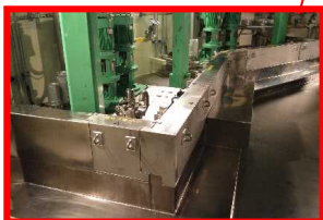
コリウムシールド

耐熱性の高い堰を設置し、溶融燃料により、鋼製の原子炉格納容器境界板の損傷を防ぐ ⇒2016年5月 工事完了