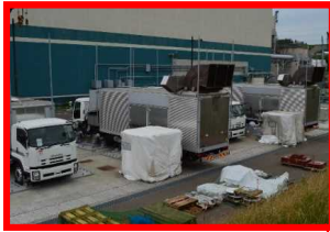
ガスタービン発電機

万が一の全交流電源喪失時にも重要機器の動力を確保する ⇒2020年11月 工事完了