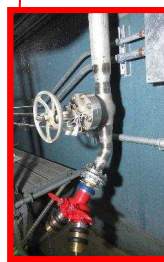
使用済燃料プールに注水するための外部接続口

重大事故発生時に外部から使用済燃料プールに注水ができるよう、消防車を接続する ⇒2015年8月 工事完了