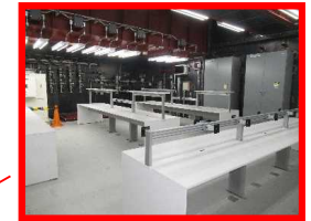
5号機原子炉建屋内緊急時対策所

重大事故等が6、7号機で発生した場合、中央制御室以外の場所から適切な指示又は連絡を行う ⇒2020年10月 工事完了