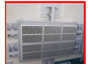
竜巻防護ネット (複数箇所)

建屋の開口部に設置し、竜巻により飛来した物の侵入を防止する ⇒2020年4月 工事完了