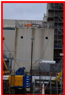
フィルタベント設備 (地上式)

放射性物質放出の影響を可能な限り低減させ、セシウム等による大規模な土壌汚染と避難の長期化を防止する ⇒2020年12月 工事完了