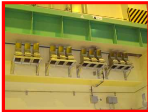
静的触媒式水素再結合装置 (PAR)

触媒の働きで、原子炉建屋に滞留した水素を酸素と再結合させ、水蒸気にする ⇒2013年9月 工事完了