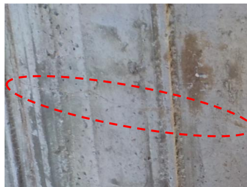
ひび割れ状況例 (No.1杭)