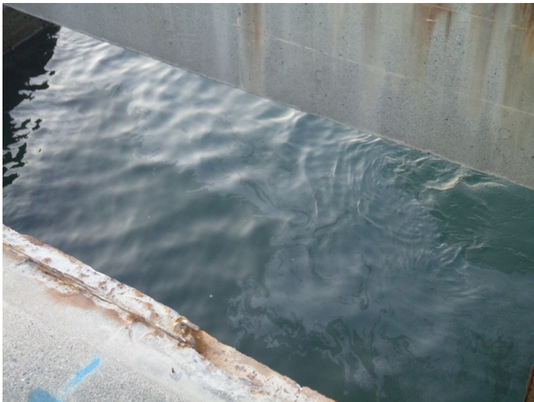
3, 4号機放水口付近における油漏えい状況図