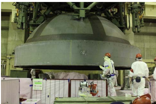
原子炉圧力容器 蓋の取り外し作業の様子 (平成24年9月14日撮影)