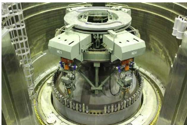
原子炉圧力容器 蓋の取り外し作業前の様子 (平成24年9月14日撮影)