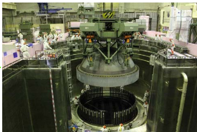
原子炉圧力容器 蓋の取り外し作業の様子 (平成24年9月14日撮影)