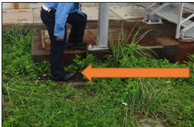
地面へ降りた際、右足を捻り負傷