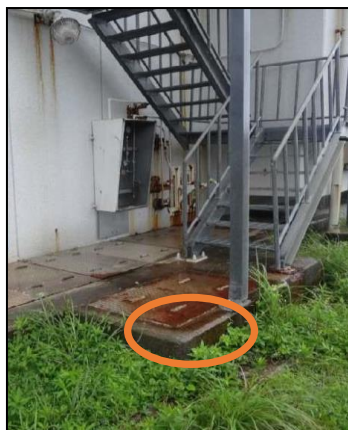
埋設トレンチの上部(鉄筋コンクリート製)