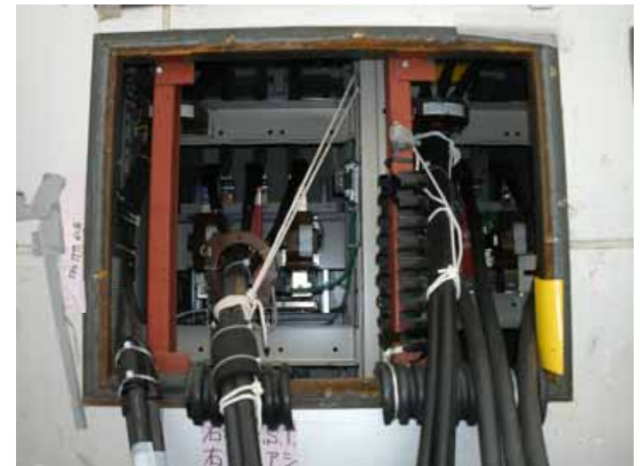
仮設M/C 3/4号電源盤の扉を開けた 状態(すすけの確認された電源盤の下)