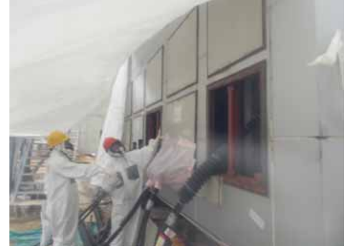
仮設M/C 3/4号点検の状況