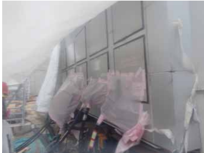
仮設M/C 3/4号 M/Cの外観