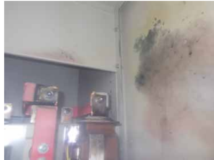
仮設M/C 3/4号 M/Cの壁面がすすけている状況