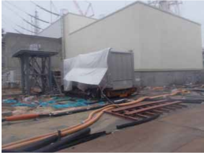
仮設M/C 3/4号 M/C(A)全景 (3/4号機開閉所)