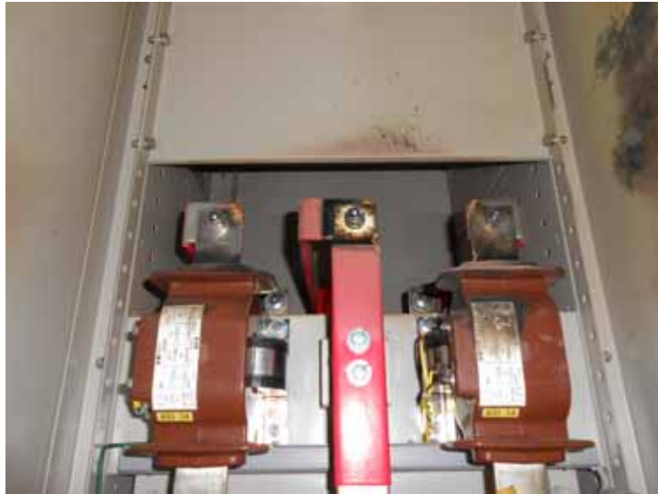
仮設M/C 3/4号 M/Cの計器用変流器(端子)がすすけている状況