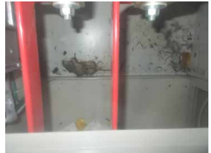
小動物の状況(上から見たイメージ)