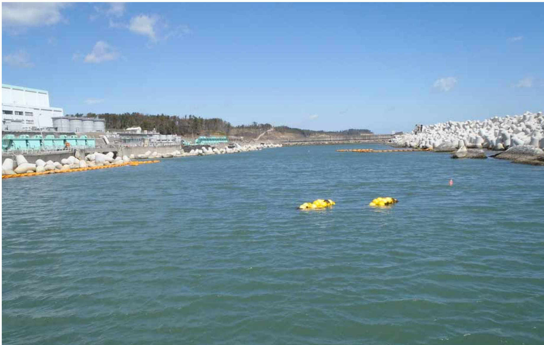
5, 6号機側シルトフェンスの状況