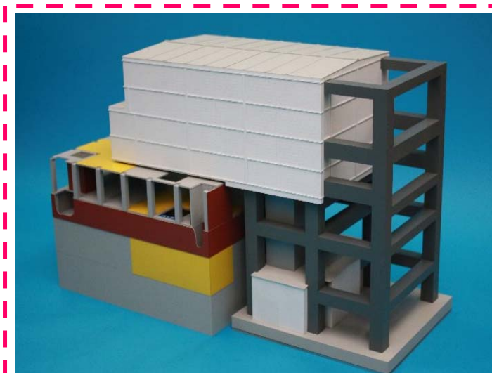
燃料取り出し用カバー〔完成イメージ〕