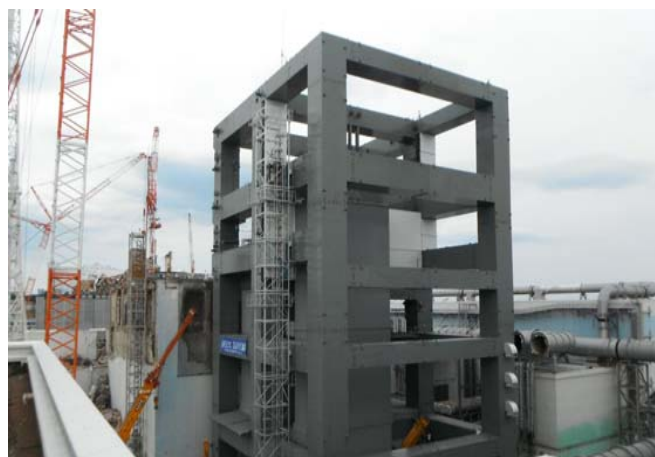
④ 原子炉建屋上部を除く鉄骨建方部分の完了 （平成25年4月10日）