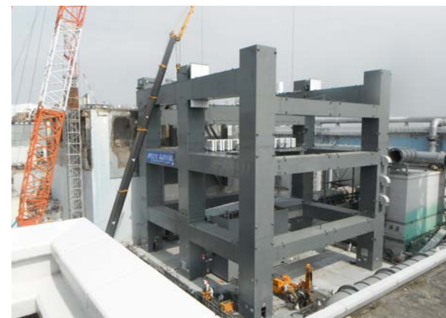
③ 第3節部分の完了（平成25年3月13日）