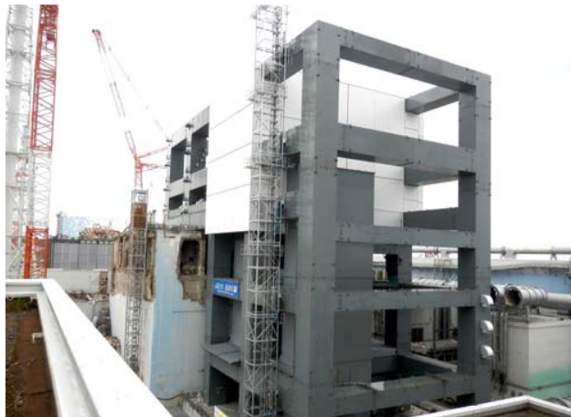
⑤ 鉄骨建方の完了（平成25年5月29日）