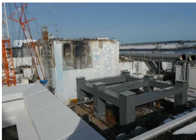
② 第1節部分の完了（平成25年1月14日）