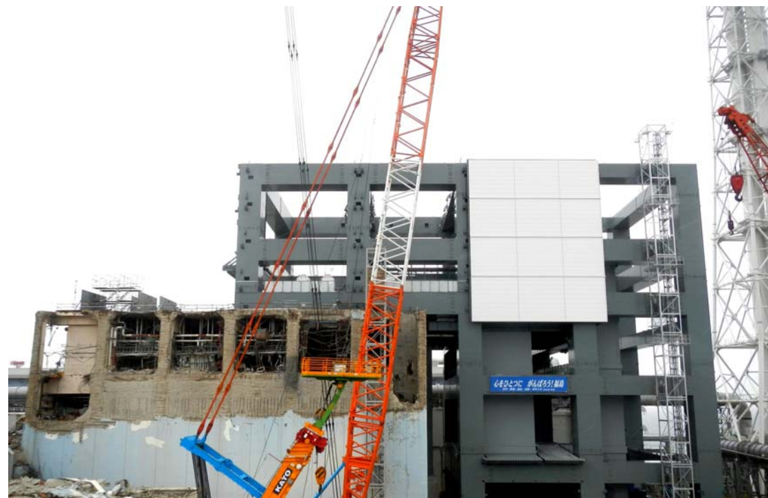
燃料取り出し用カバー（平成25年5月29日現在）

※ 鉄骨建方工事と併行して、設置可能な東西および南面の外壁パネルの設置も行っております。