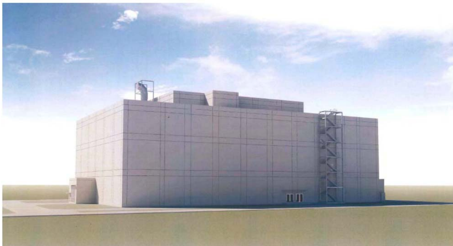
雑固体廃棄物焼却設備建屋 イメージ図

今後、基礎工事、建物工事、焼却設備の設置等の工程を経て、平成26年度中の運用開始に向けて、工事を進めてまいります。